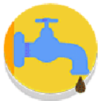
NEADEKVATNA SANITACIJA, VODA I HIGIJENA