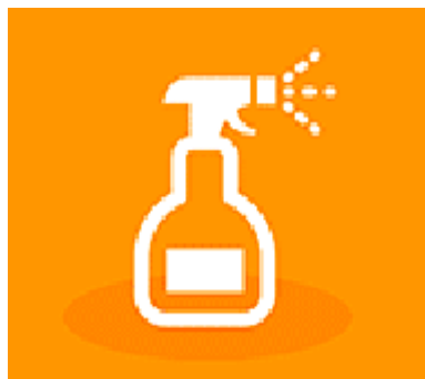
Postojani organski zagađivači/ endokrini disruptori